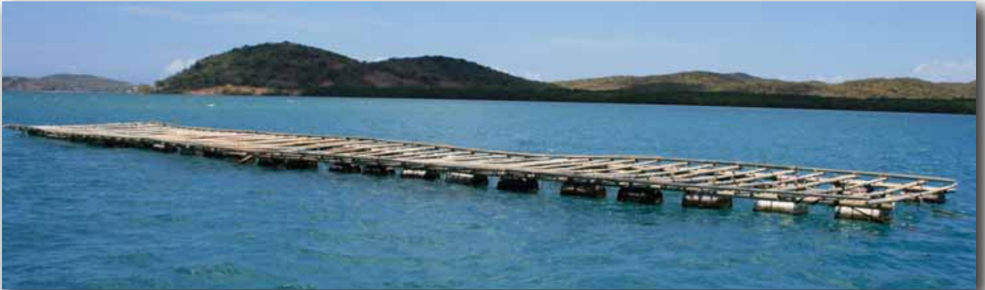
Sistema de balsas flotantes de la granja KAZU PEARLS.

Como dispositivos de flotación cada balsa emplea contenedores vacíos sellados de tipo barril similar a los que se emplean en el almacenamiento de combustibles, firmemente sujetos a la balsa en su sección inferior, con un espacio aproximadamente de 1.5 a 2 metros de separación en cada segmento estructural, variando en longitud dependiendo del tamaño de la balsa.