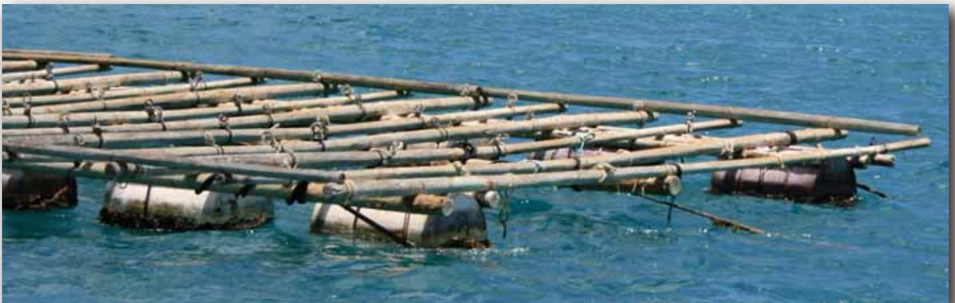
Dispositivos de flotación y cuerdas de anclaje de las balsas flotantes.

Friday Island, Torres Strait, Australia.