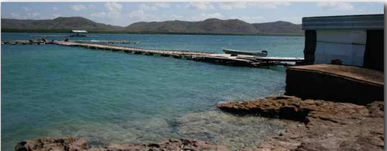
CULTIVO DE OSTRAS PARA PRODUCCIÓN DE PERLAS, EN FRIDAY ISLAND, TORRES STRAIT, AUSTRALIA.