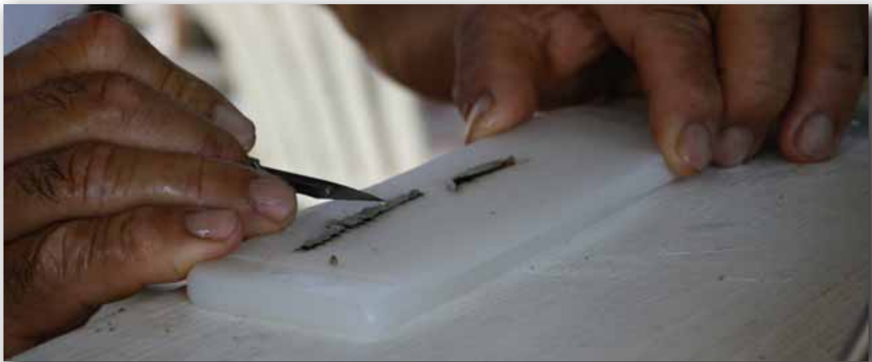
CULTIVO DE OSTRAS PARA PRODUCCIÓN DE PERLAS, EN FRIDAY ISLAND, TORRES STRAIT, AUSTRALIA.

Se sacrifica el organismo donador, seleccionando el manto de la sección interior, o la parte mas cercana a la masa visceral debido a que la calidad del nácar es mayor comparada con la que se produce en las secciones periféricas del manto. El tejido se corta con tijeras perfectamente afiladas, cortando una sección de entre 6 a 10 cm de longitud y un grosor de 3 a 4 mm. El tejido donador se corta en segmentos de aproximadamente 4 mm que se emplean a razón de uno por cada núcleo colocado en la gónada de las ostras.